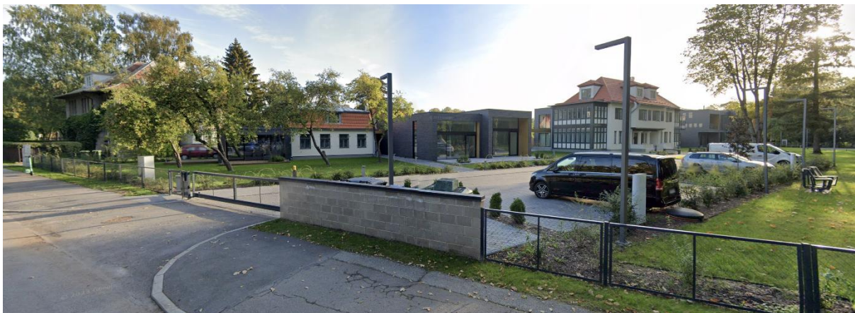
Joonis 2 Vaade Mere pst 12 kinnistule

Olemasolevad hooned paiknevad kinnistu põhjaservas ning krunt ise on ruumiliselt avatud Pärnu rannaparki, mis avab ka hoonestusele vaated pargist.